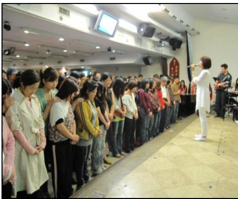
2011/10/31 台灣五股禮拜堂 多人接受主

我常在想, 泥土音樂的服事, 常常得到從人來的讚賞, 也看見“做工的果效”, 我們也為此感恩, 深感榮幸. 但真正重要的是: 神到底怎麼看我們?